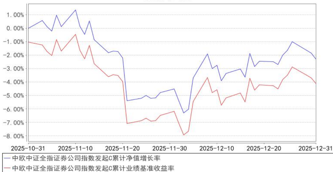
中欧中证全指证券公司指数发起C累计净值增长率与同期业绩比较基准收益率的历史走势对比图

注：本基金基金合同生效日期为 2025 年 10 月 31 日，自基金合同生效日起到本报告期末不满一年，按基金合同的规定，本基金自基金合同生效起六个月为建仓期，建仓期结束时各项资产配置比例应当符合基金合同约定。