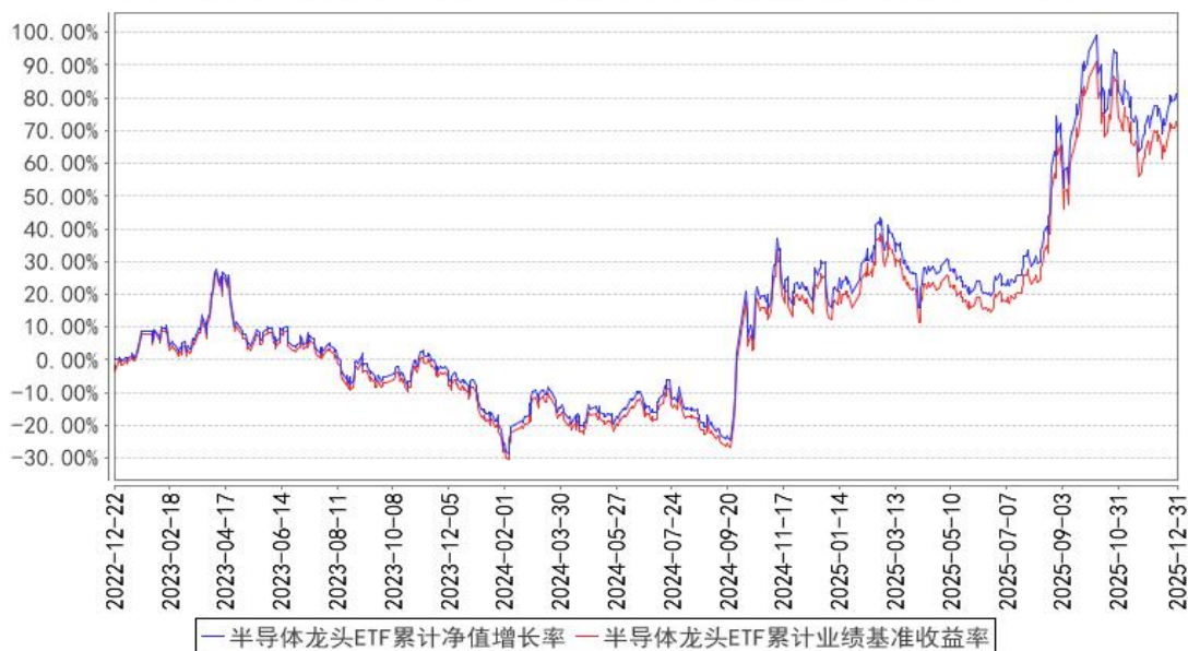
半导体龙头ETF累计净值增长率与同期业绩比较基准收益率的历史走势对比图