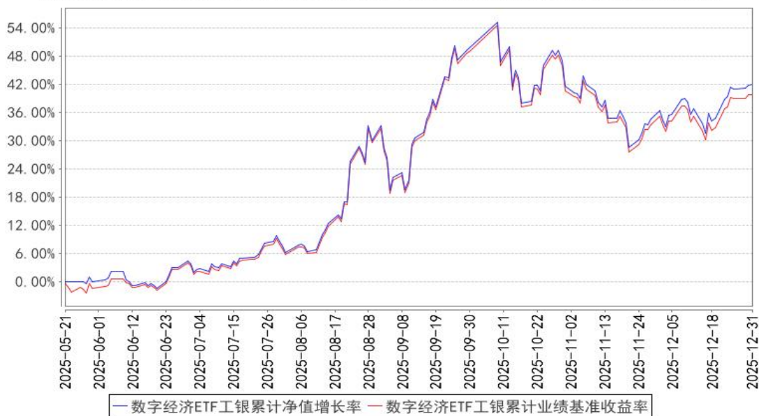
数字经济ETF工银累计净值增长率与同期业绩比较基准收益率的历史走势对比图

注：1、本基金基金合同于 2025 年 5 月 21 日生效。截至报告期末，本基金基金合同生效不满一年。