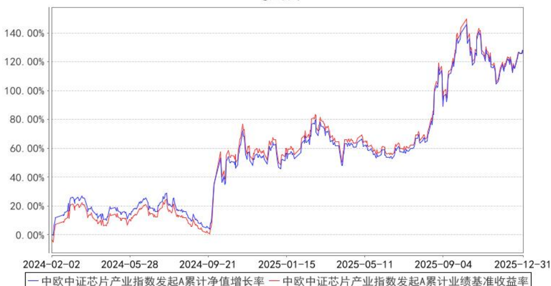
中欧中证芯片产业指数发起A累计净值增长率与同期业绩比较基准收益率的历史走势对比图