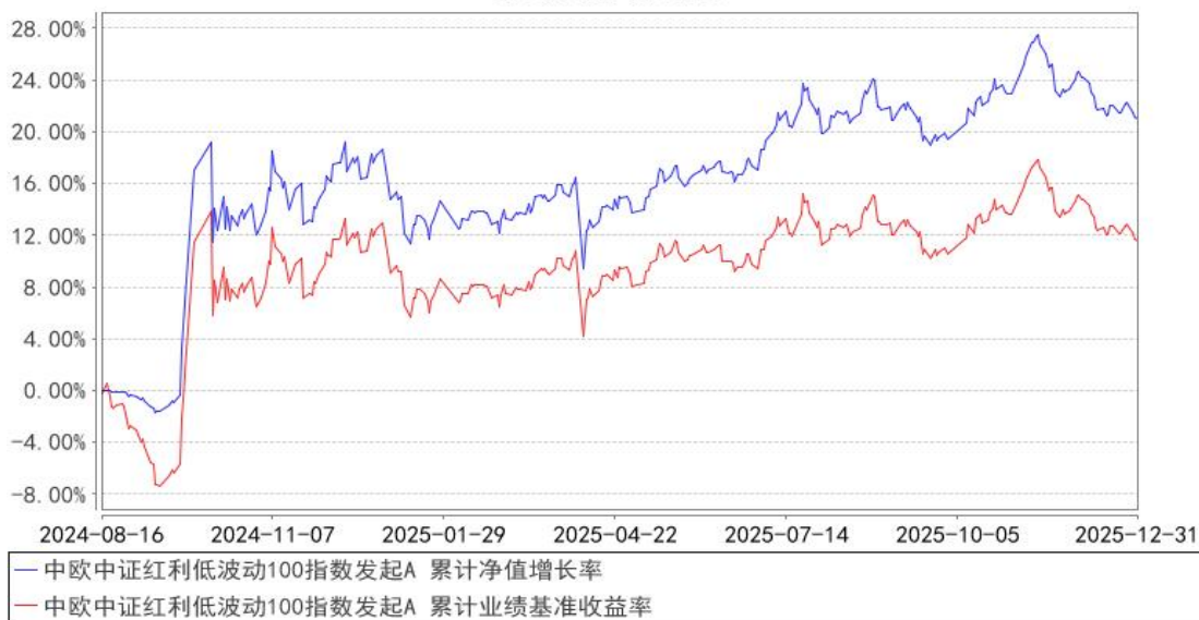
中欧中证红利低波动100指数发起A 累计净值增长率与同期业绩比较基准收益率的历史走势对比图

注：本基金基金合同生效日期为 2024 年 8 月 16 日，按基金合同的规定，本基金自基金合同生效起六个月为建仓期，建仓期结束时各项资产配置比例已经符合基金合同约定。