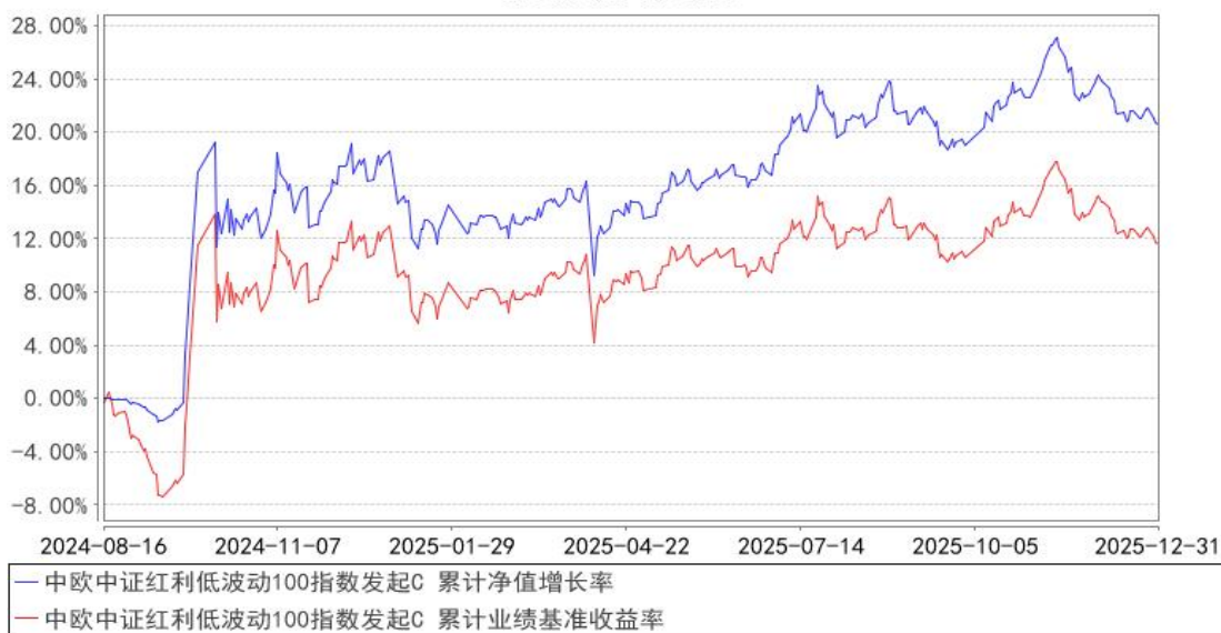
中欧中证红利低波动100指数发起C 累计净值增长率与同期业绩比较基准收益率的历史走势对比图

注：本基金基金合同生效日期为 2024 年 8 月 16 日，按基金合同的规定，本基金自基金合同生效起六个月为建仓期，建仓期结束时各项资产配置比例已经符合基金合同约定。