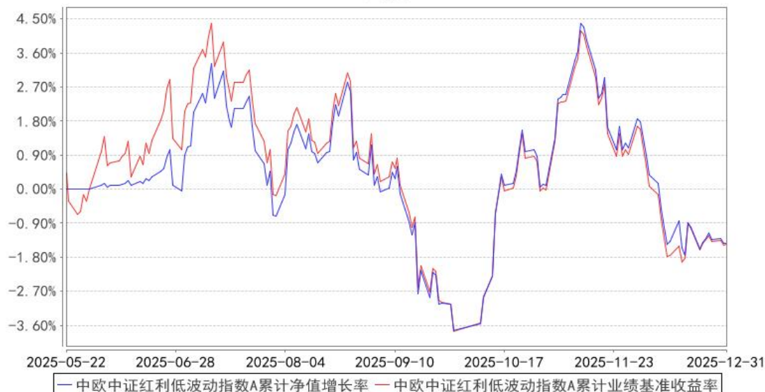
中欧中证红利低波动指数A累计净值增长率与同期业绩比较基准收益率的历史走势对比图

注：本基金基金合同生效日期为 2025 年 5 月 22 日，自基金合同生效日起到本报告期末不满一年，按基金合同的规定，本基金自基金合同生效起六个月为建仓期，建仓期结束时各项资产配置比例已经符合基金合同约定。