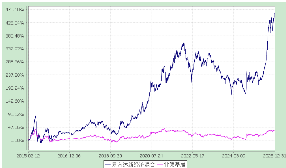
易方达新经济灵活配置混合型证券投资基金 份额累计净值增长率与业绩比较基准收益率历史走势对比图 (2015 年 2 月 12 日至 2025 年 12 月 31 日)