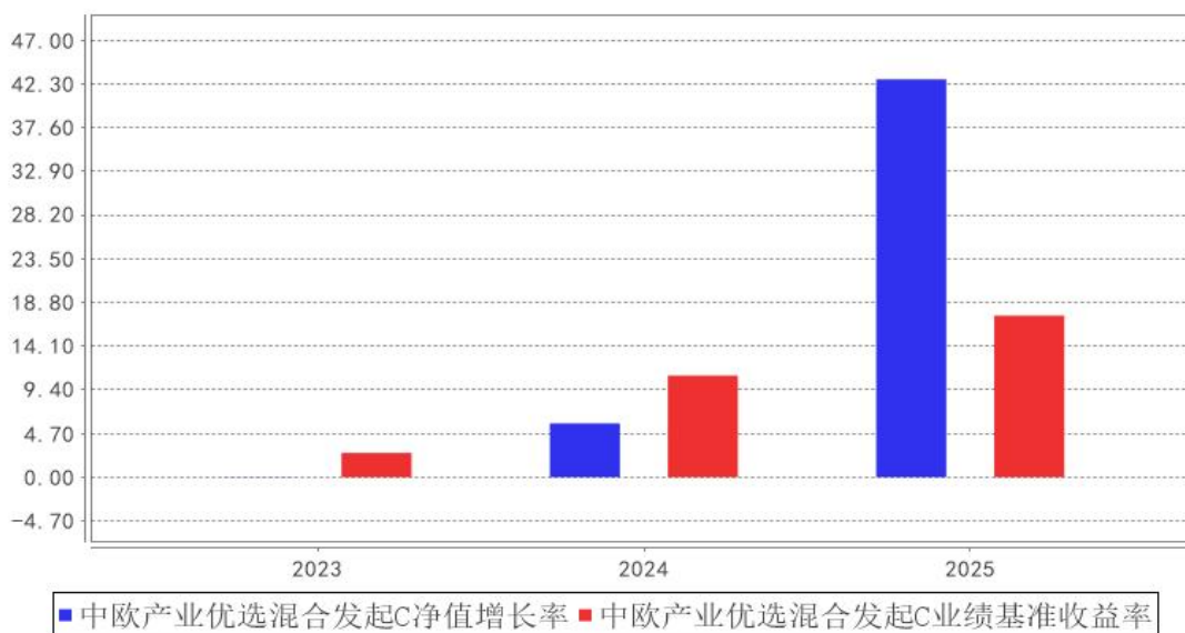
中欧产业优选混合发起C基金每年净值增长率与同期业绩比较基准收益率的对比图

注：本基金合同生效日为 2023 年 12 月 27 日，2023 年度数据为 2023 年 12 月 27 日至 2023 年 12 月 31 日数据。