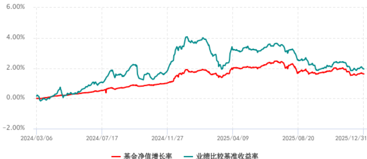
基金份额累计净值增长率与同期业绩比较基准收益率历史走势对比图 (2024年03月06日-2025年12月31日)