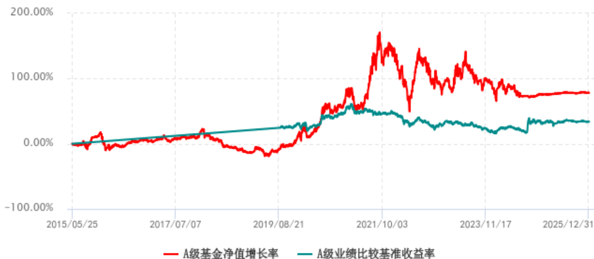
A 级基金份额累计净值增长率与同期业绩比较基准收益率历史走势对比图 (2015年05月25日-2025年12月31日)