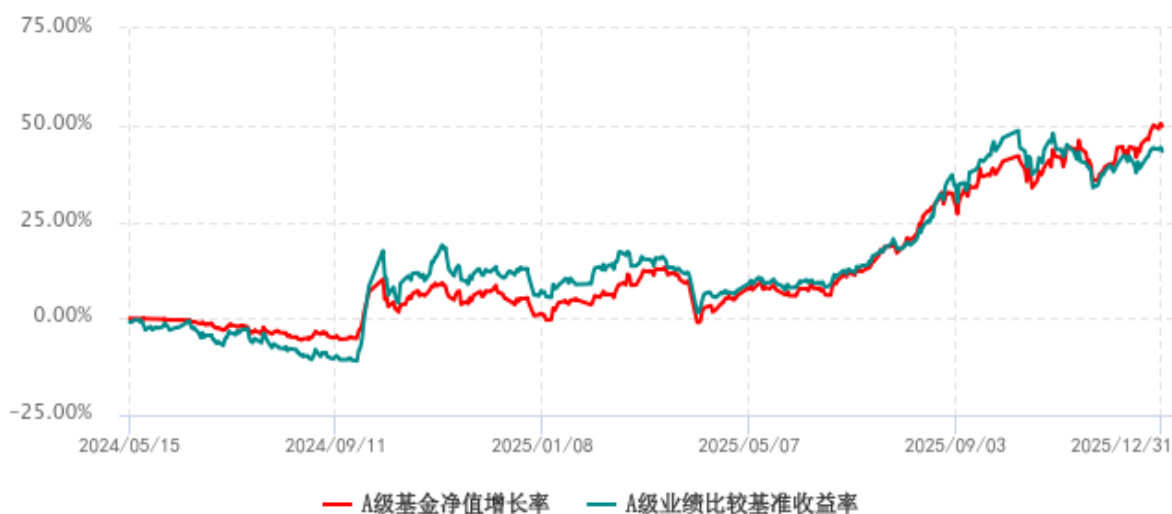
A级基金份额累计净值增长率与同期业绩比较基准收益率历史走势对比图 (2024年05月15日-2025年12月31日)