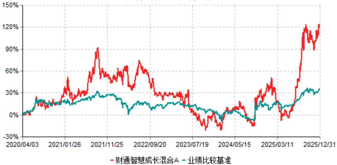
财通智慧成长混合A累计净值增长率与业绩比较基准收益率历史走势对比图 (2020年04月03日-2025年12月31日)