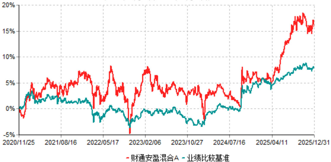
财通安盈混合A累计净值增长率与业绩比较基准收益率历史走势对比图 (2020年11月25日-2025年12月31日)