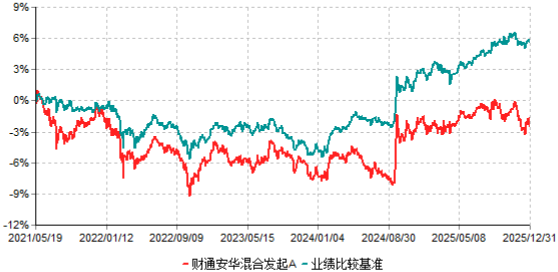
财通安华混合发起A累计净值增长率与业绩比较基准收益率历史走势对比图 (2021年05月19日-2025年12月31日)