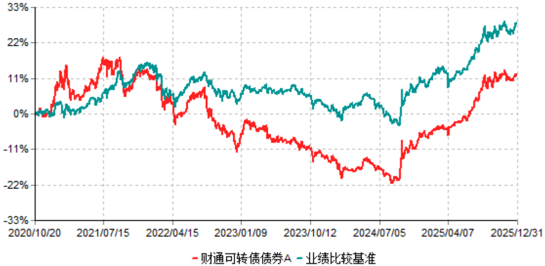
财通可转债债券A累计净值增长率与业绩比较基准收益率历史走势对比图 (2020年10月20日-2025年12月31日)