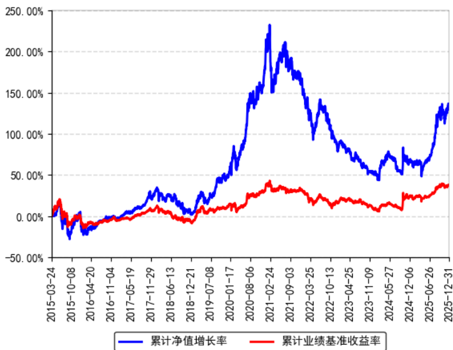
南方创新经济灵活配置混合累计净值增长率与同期业绩比较基准收益率的历史走势对比图