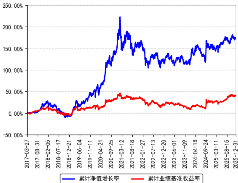
南方智慧精选灵活配置混合累计净值增长率与同期业绩比较基准收益率的历史走势对比图