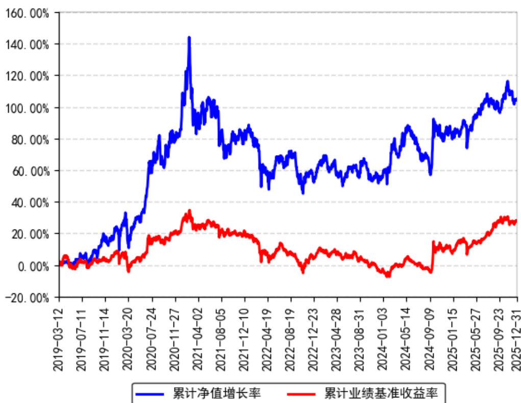
南方智诚混合累计净值增长率与同期业绩比较基准收益率的历史走势对比图