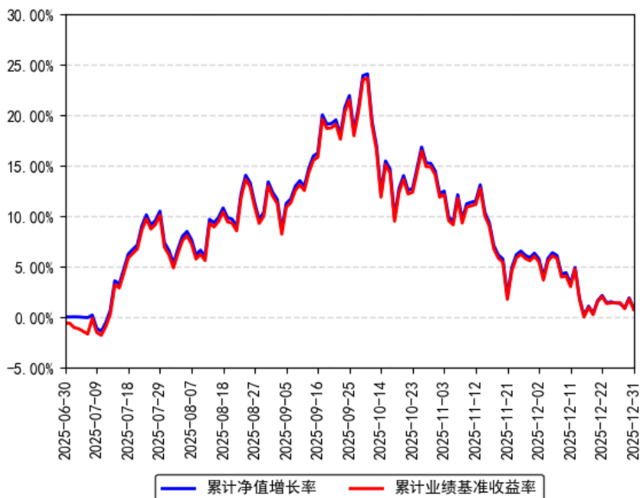
南方中证港股通科技ETF累计净值增长率与同期业绩比较基准收益率的历史走势对比图

注：本基金合同于 2025 年 6 月 30 日生效，截至本报告期末基金成立未满一年；自基金成立日起 6 个月内为建仓期，建仓期结束时各项资产配置比例符合合同约定。