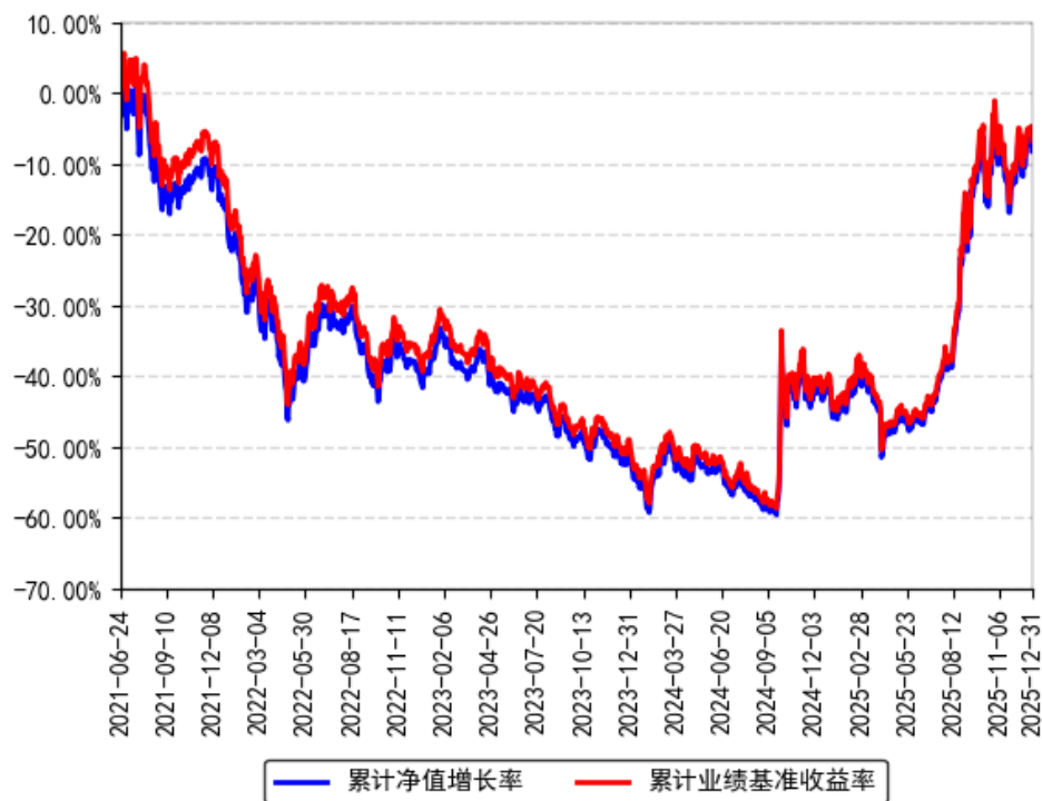
南方中证科创创业50ETF累计净值增长率与同期业绩比较基准收益率的历史走势对比图