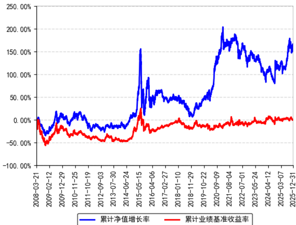
南方盛元红利混合累计净值增长率与同期业绩比较基准收益率的历史走势对比图