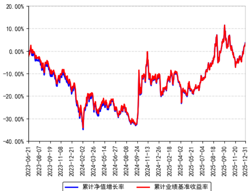
南方中证国新央企科技引领ETF累计净值增长率与同期业绩比较基准收益率的历史走势对比图