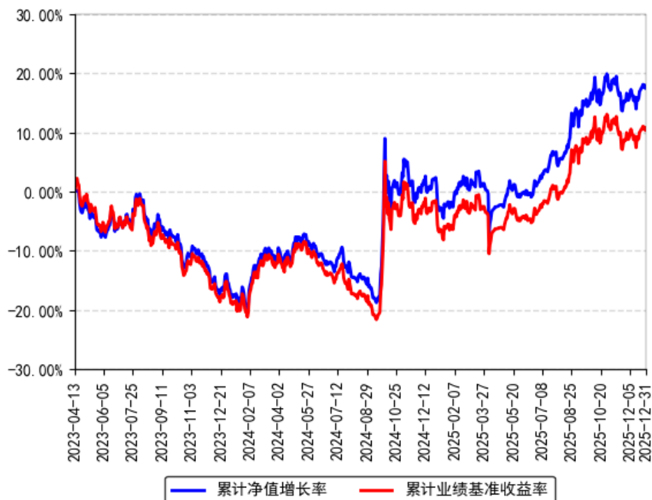
南方沪深300ESG基准ETF累计净值增长率与同期业绩比较基准收益率的历史走势对比图