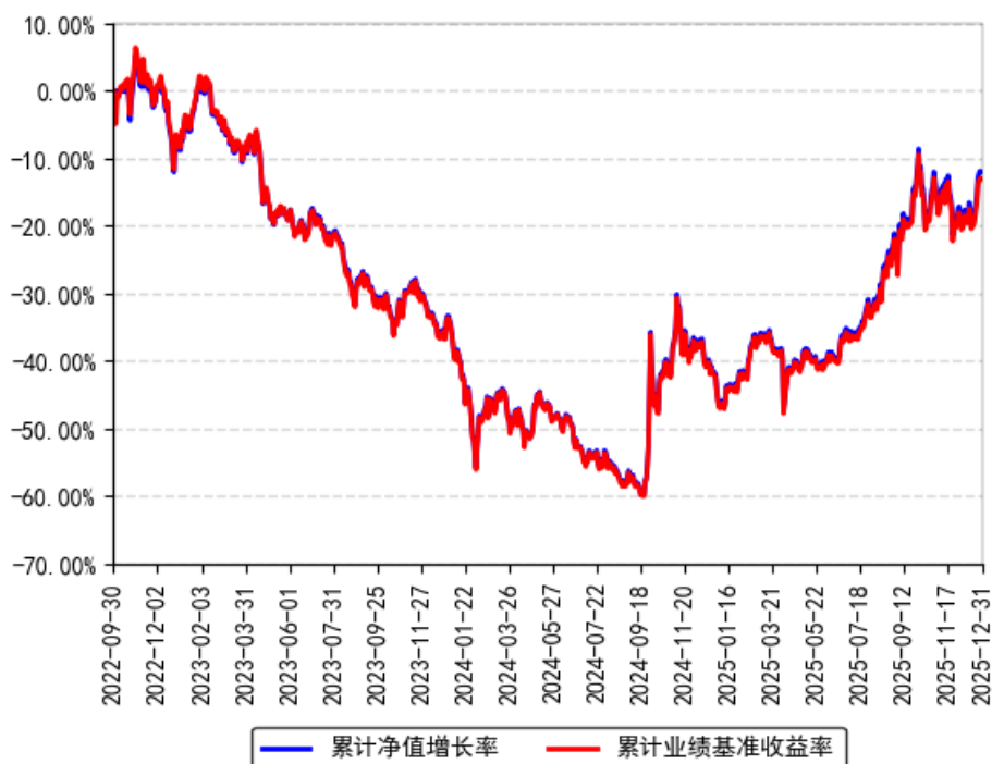
南方上证科创板新材料ETF累计净值增长率与同期业绩比较基准收益率的历史走势对比图