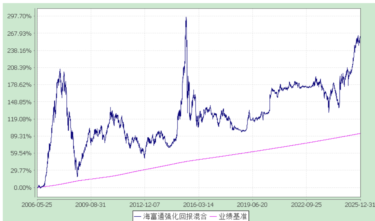
海富通强化回报混合型证券投资基金 份额累计净值增长率与业绩比较基准收益率的历史走势对比图 (2006年5月25日至2025年12月31日)

注：按照本基金合同规定,本基金建仓期为基金合同生效之日起六个月。建仓期满至今,本基金投资组合均达到本基金合同第十二条(二)、(七)规定的比例限制及本基金投资组合的比例范围。