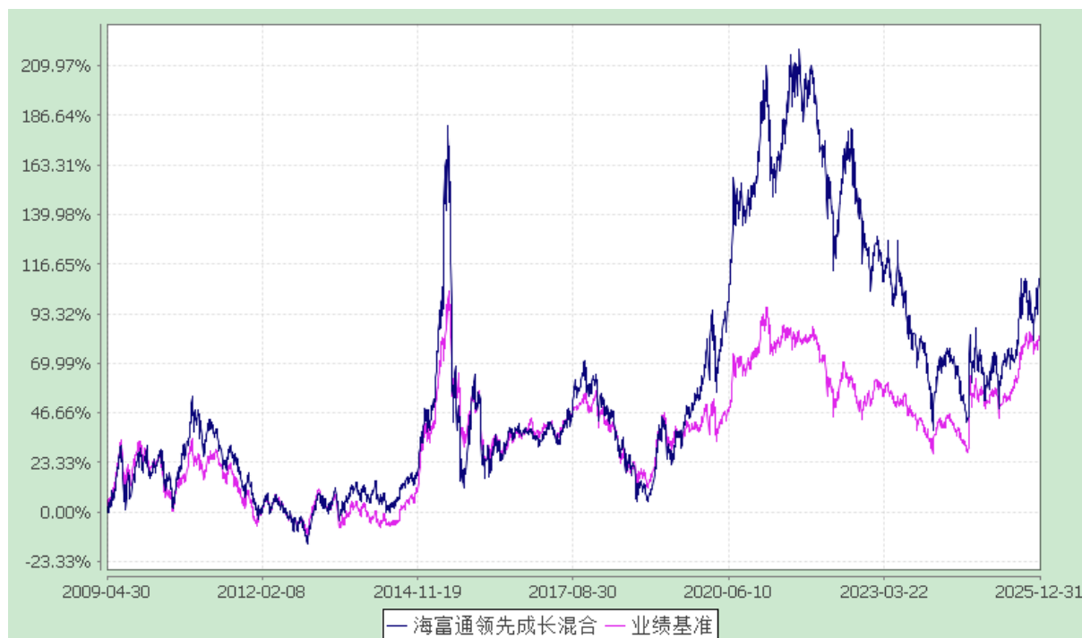
海富通领先成长混合型证券投资基金 份额累计净值增长率与业绩比较基准收益率的历史走势对比图 (2009年4月30日至2025年12月31日)

注：按照基金合同规定，本基金建仓期为基金合同生效之日起六个月，即 2009 年 4 月 30 日至 2009 年 10 月 29 日。建仓期结束时本基金投资组合均达到本基金合同第十二条（二）、（七）规定的比例限制及本基金投资组合的比例范围。