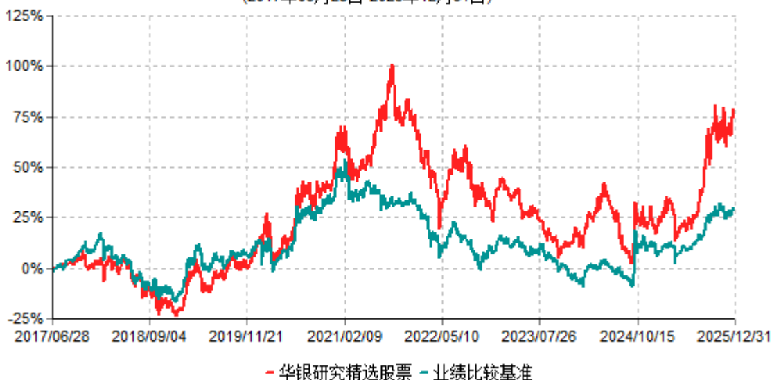
华银研究精选股票累计净值增长率与业绩比较基准收益率历史走势对比图 (2017年06月28日-2025年12月31日)