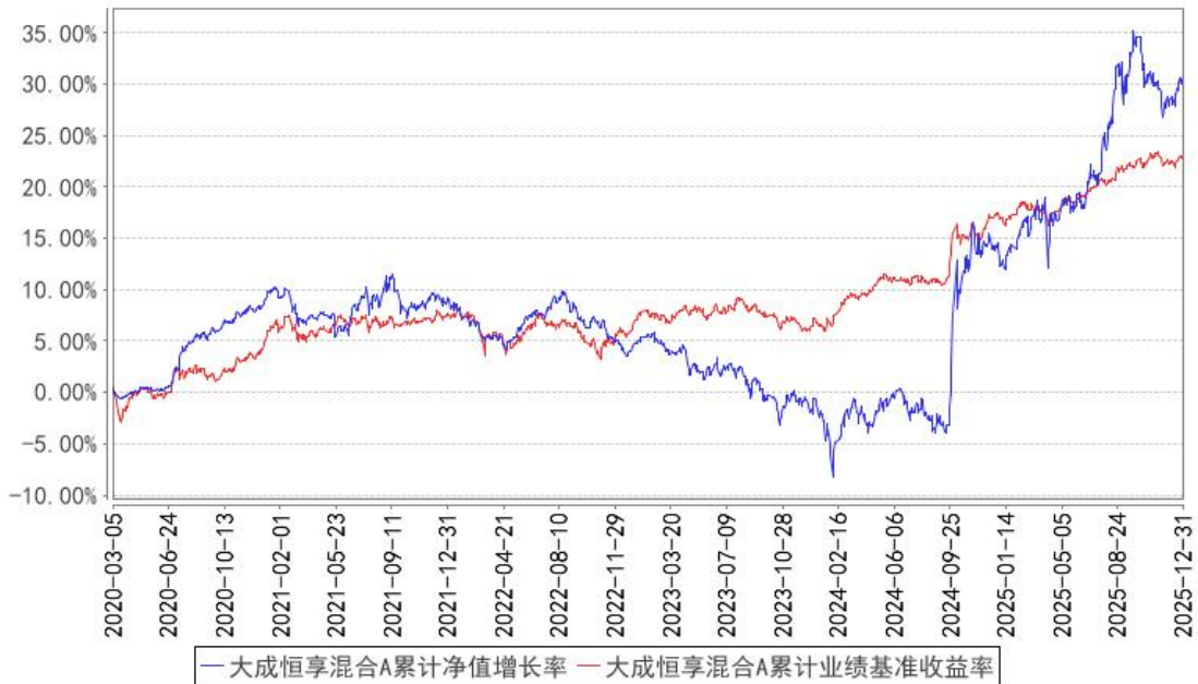
大成恒享混合A累计净值增长率与同期业绩比较基准收益率的历史走势对比图

(二) 自基金合同生效以来基金份额累计净值增长率变动及其与同期业绩比较基准收益率变动的比较