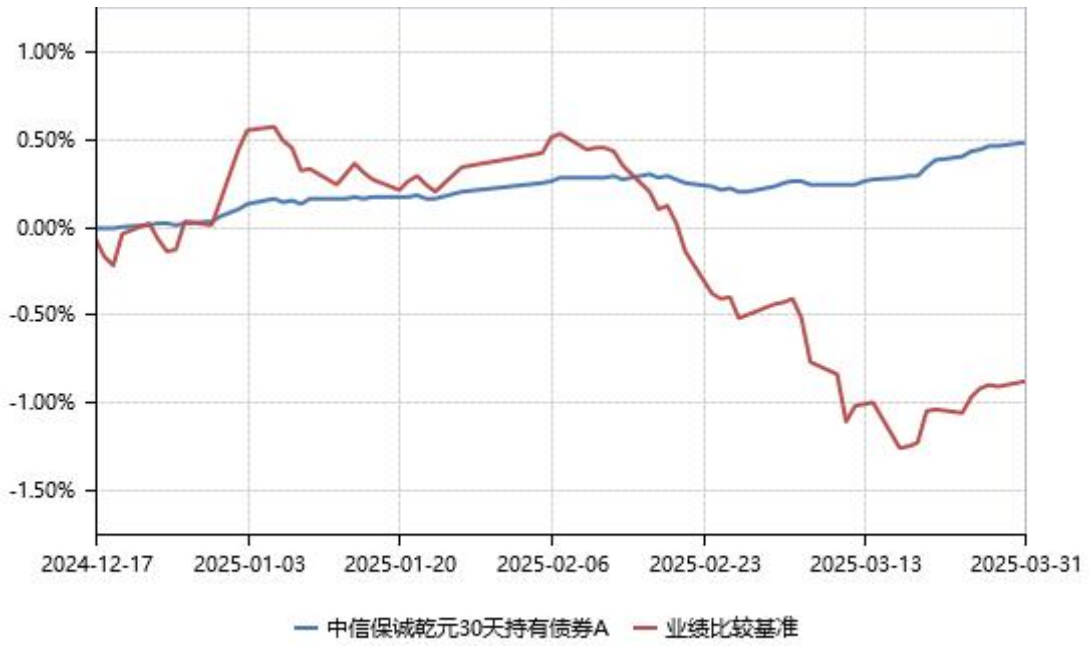
中信保诚乾元 30 天持有债券 C