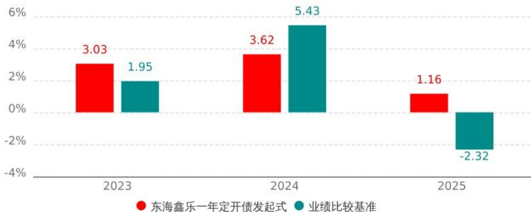
基金的过往业绩不代表未来表现，数据截止日：2025年12月31日

本基金合同于2023年3月17日生效，合同生效当年按实际存续期计算，不按整个自然年度进行折算。业绩表现截止日期2025年12月31日。基金过往业绩不代表未来表现。