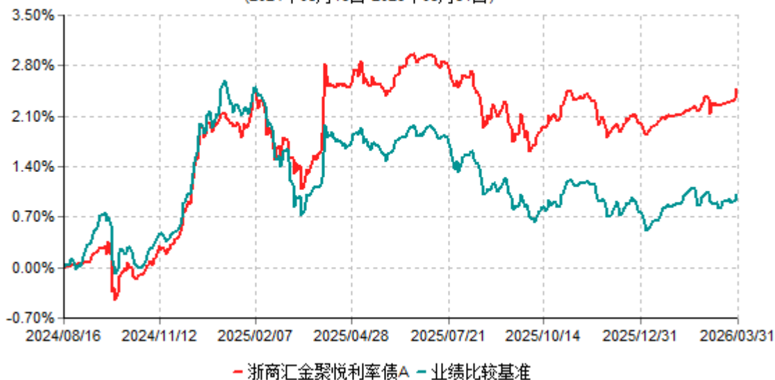
浙商汇金聚悦利率债A累计净值增长率与业绩比较基准收益率历史走势对比图 (2024年08月16日-2026年03月31日)