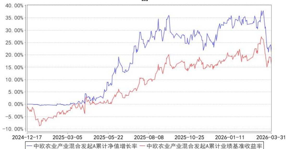
中欧农业产业混合发起A累计净值增长率与同期业绩比较基准收益率的历史走势对比图

注：本基金基金合同生效日期为 2024 年 12 月 17 日，按基金合同的规定，本基金自基金合同生效起六个月为建仓期，建仓期结束时各项资产配置比例已经符合基金合同约定。