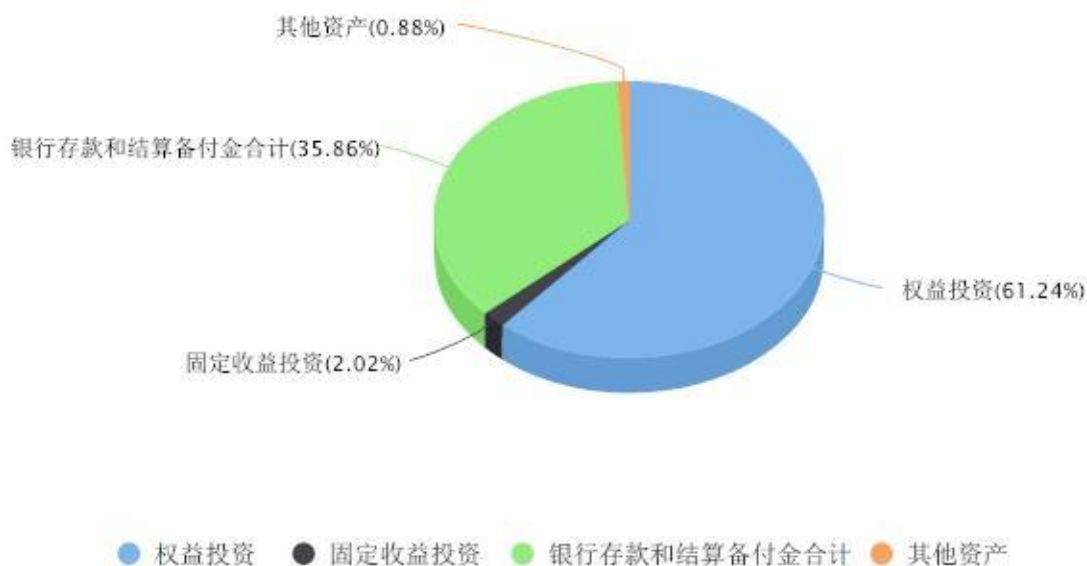
投资组合资产配置图表 数据截止日期:2025年12月31日