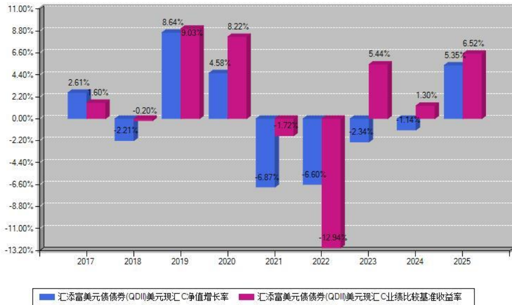
汇添富美元债债券(QDII)美元现汇C每年净值增长率与同期业绩基准收益率对比图

注：数据截止日期为2025年12月31日，基金的过往业绩不代表未来表现。本《基金合同》生效之日为2017年04月20日，合同生效当年按实际存续期计算，不按整个自然年度进行折算。