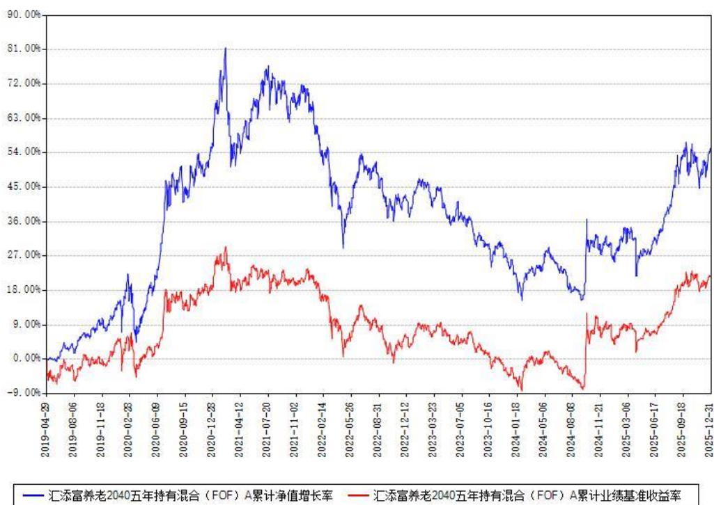
汇添富养老2040五年持有混合 (FOF) A累计净值增长率与同期业绩基准收益率对比图