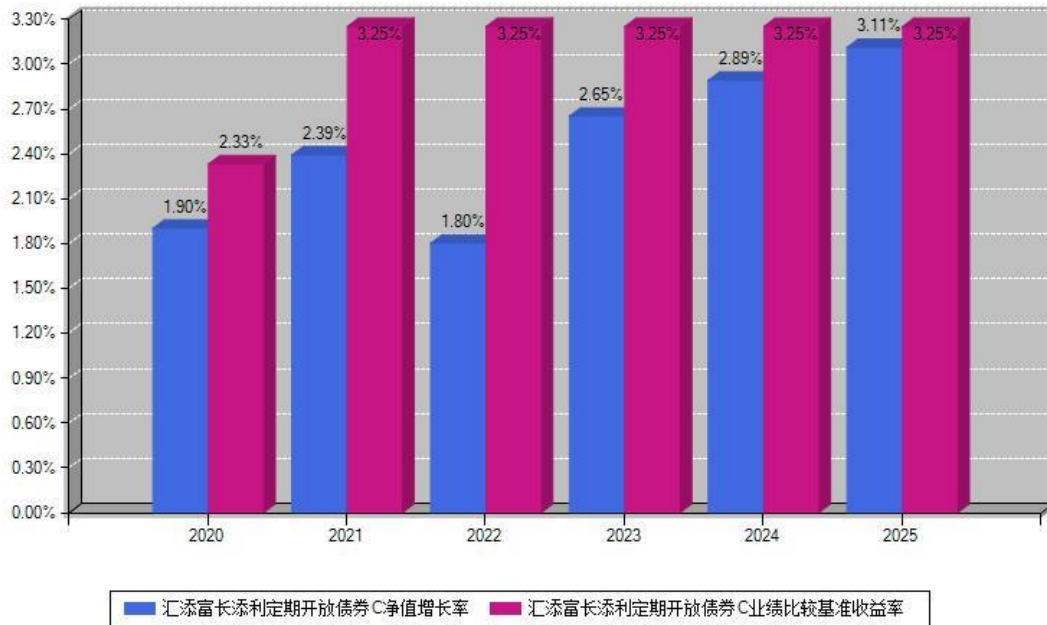
汇添富长添利定期开放债券C每年净值增长率与同期业绩基准收益率对比图

注：数据截止日期为2025年12月31日，基金的过往业绩不代表未来表现。本《基金合同》生效之日为2020年04月14日，合同生效当年按实际存续期计算，不按整个自然年度进行折算。