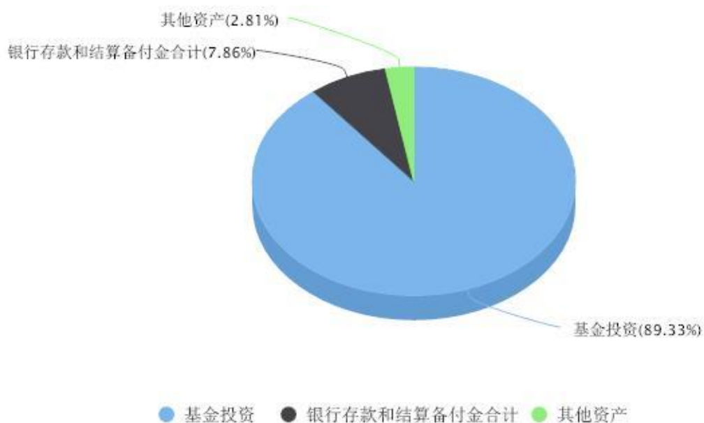
投资组合资产配置图表 数据截止日期:2025年12月31日