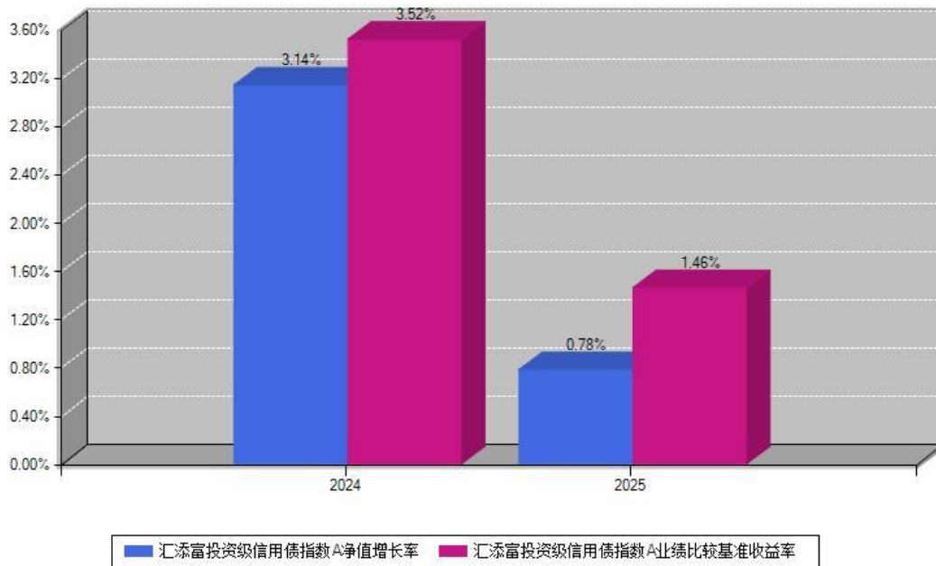
汇添富投资级信用债指数A每年净值增长率与同期业绩基准收益率对比图

注：数据截止日期为2025年12月31日，基金的过往业绩不代表未来表现。本《基金合同》生效之日为2024年04月17日，合同生效当年按实际存续期计算，不按整个自然年度进行折算。