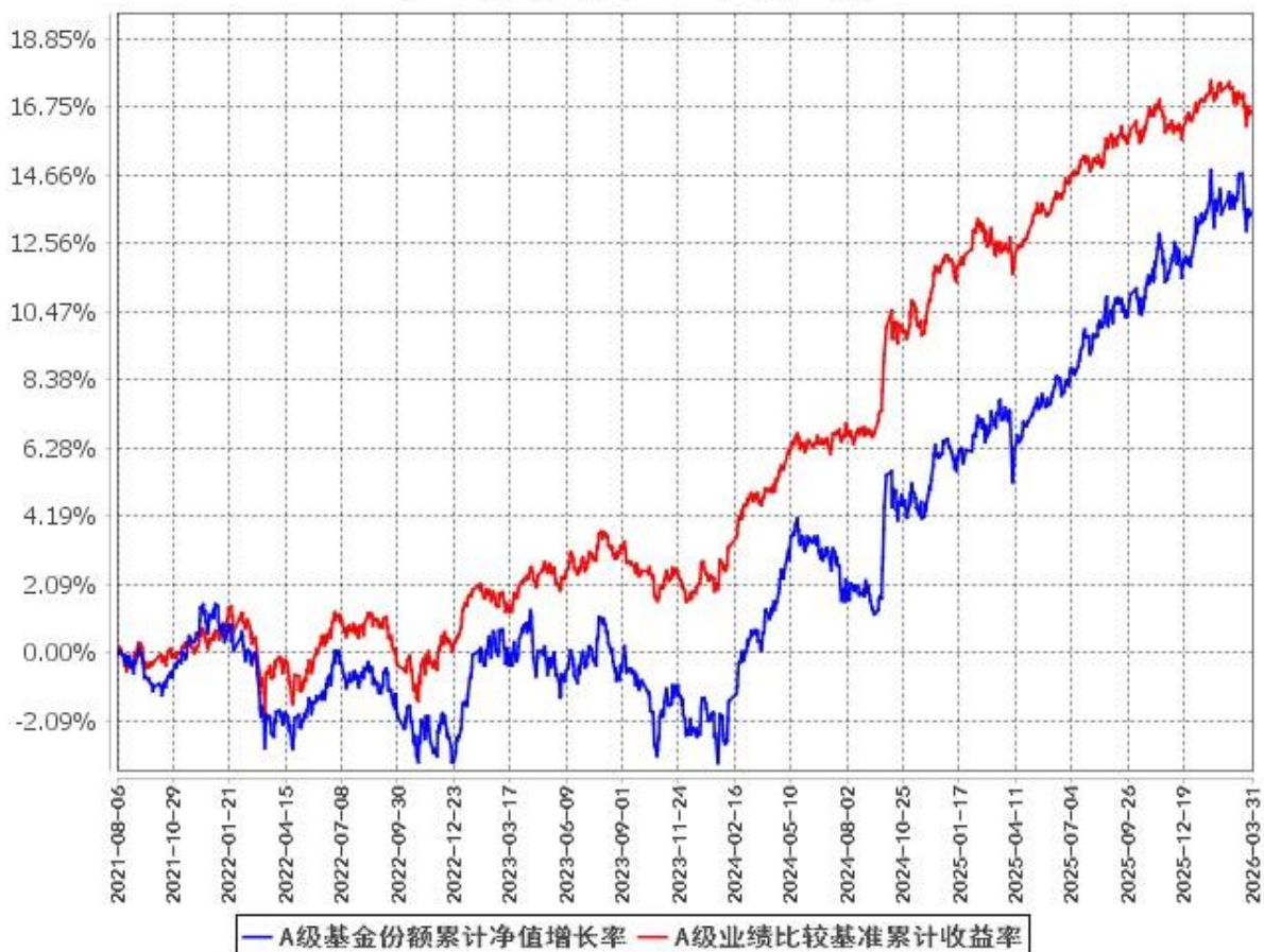
A级基金份额累计净值增长率与同期业绩比较基准收益率的历史走势对比图 (2021年8月6日至2026年3月31日)