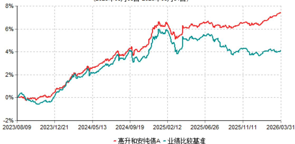
惠升和安纯债A累计净值增长率与业绩比较基准收益率历史走势对比图 (2023年08月09日-2026年03月31日)