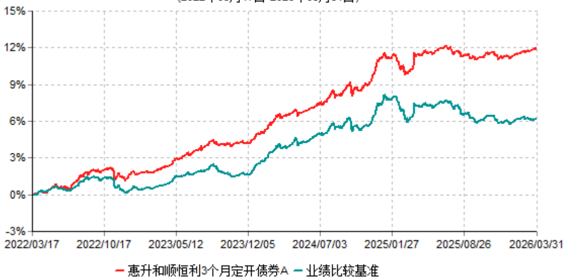
惠升和顺恒利3个月定开债券A累计净值增长率与业绩比较基准收益率历史走势对比图 (2022年03月17日-2026年03月31日)