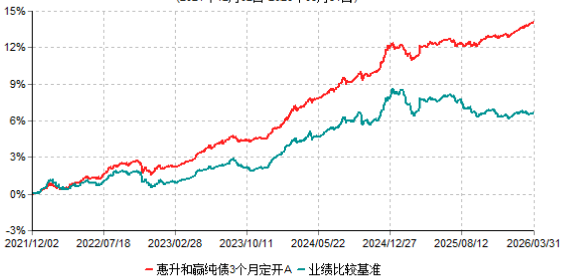
惠升和赢纯债3个月定开A累计净值增长率与业绩比较基准收益率历史走势对比图 (2021年12月02日-2026年03月31日)