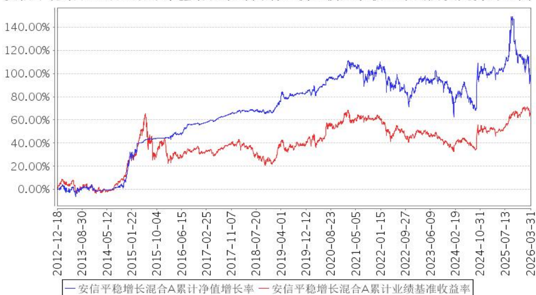
安信平稳增长混合A累计净值增长率与同期业绩比较基准收益率的历史走势对比图