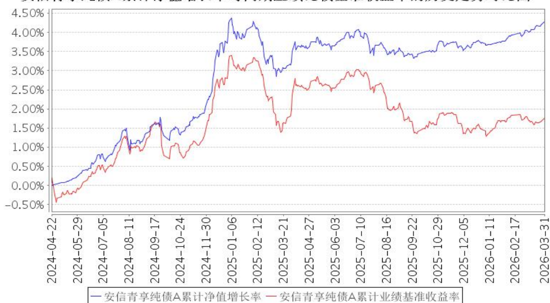
安信青享纯债A累计净值增长率与同期业绩比较基准收益率的历史走势对比图