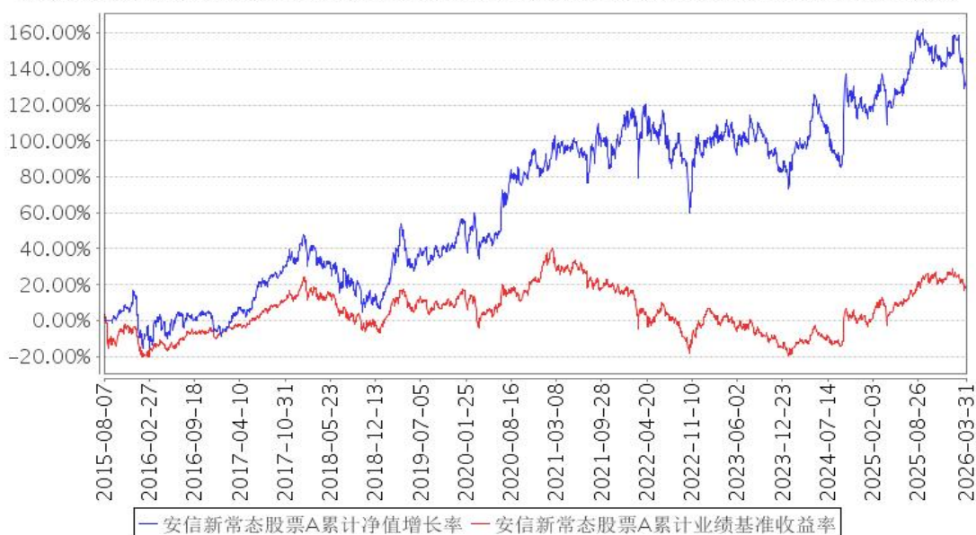
安信新常态股票A累计净值增长率与同期业绩比较基准收益率的历史走势对比图