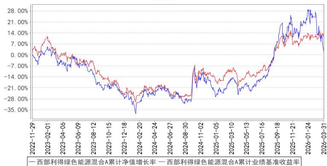
西部利得绿色能源混合A累计净值增长率与同期业绩比较基准收益率的历史走势对比图