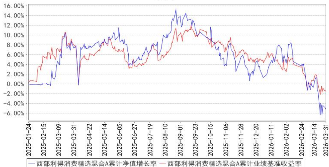
西部利得消费精选混合A累计净值增长率与同期业绩比较基准收益率的历史走势对比图