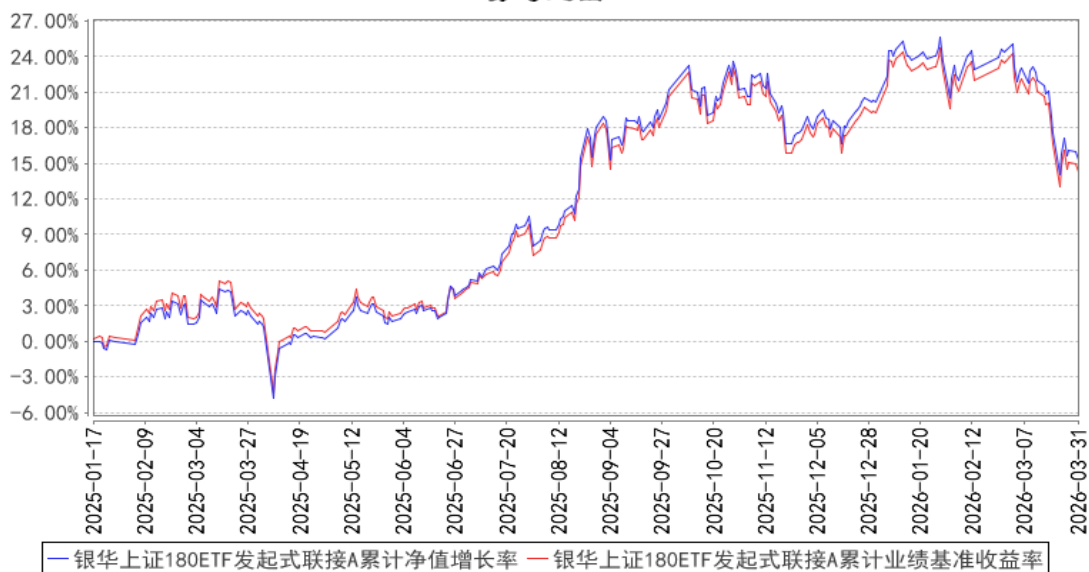
银华上证180ETF发起式联接A累计净值增长率与同期业绩比较基准收益率的历史走势对比图