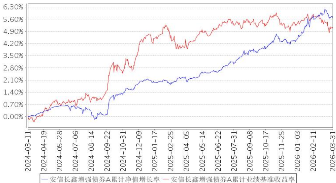
安信长鑫增强债券A累计净值增长率与同期业绩比较基准收益率的历史走势对比图