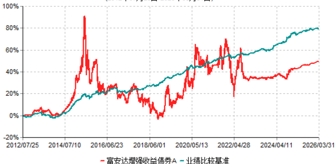
富安达增强收益债券A累计净值增长率与业绩比较基准收益率历史走势对比图 (2012年07月25日-2026年03月31日)